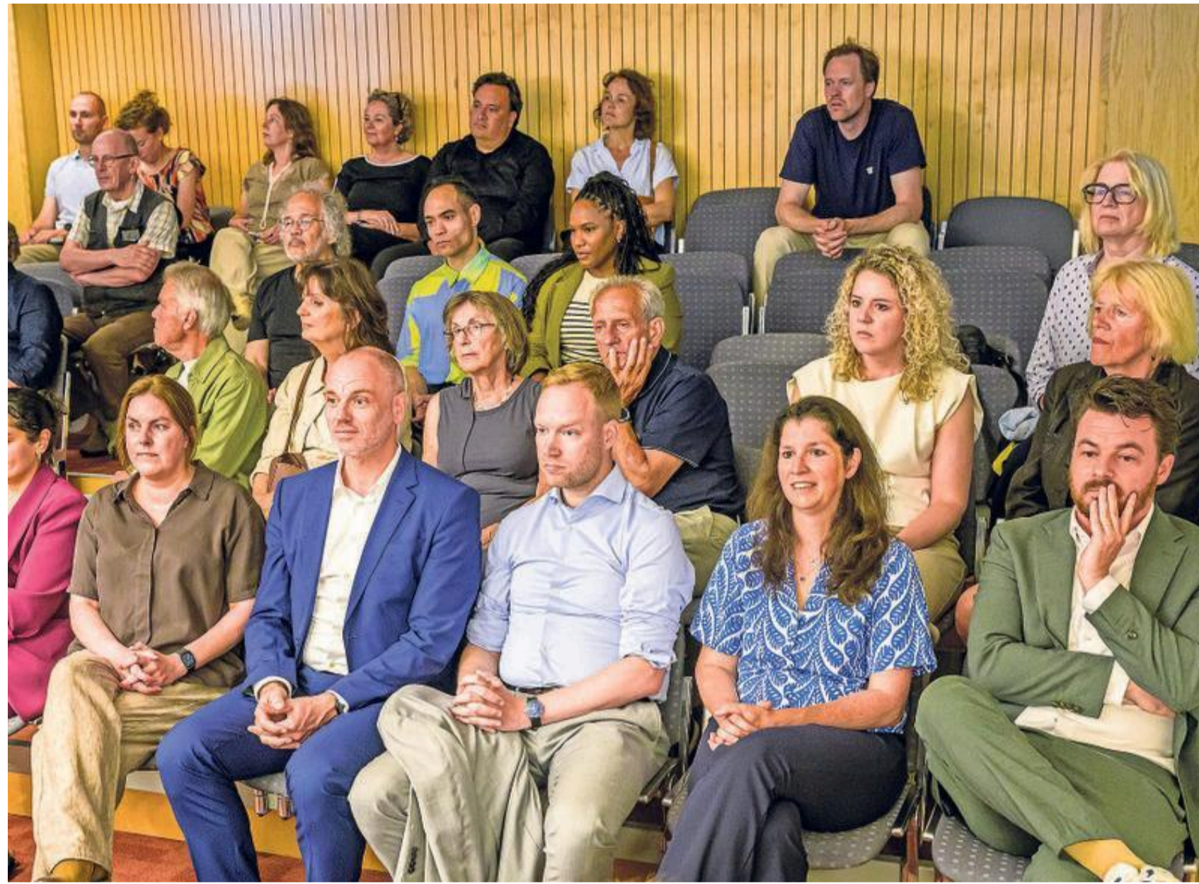
Raadsleden en wethouders tijdens het debat over het coalitieakkoord.

meestal gecombineerd met een baan, gezin of studie, terwijl dosiers dikker worden en inwoners meer van hun volksvertegenwoordigers verwachten. Uit onderzoek van Binnenlands Bestuur blijkt dat raadsleden gemiddeld tussen de 16 en 18 uur per week besteden aan hun politieke werkzaamheden. Oppositieraadsleden zijn daar zelfs iets meer tijd aan kwijt dan hun collega's in de