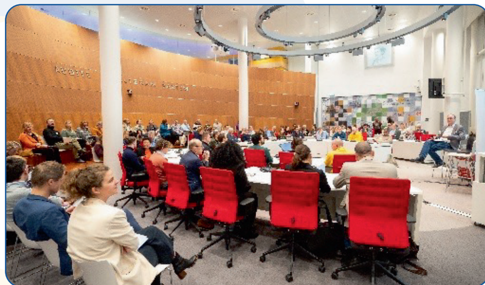
Klaar voor Vier Jaar-bijeenkomst (januari 2026, Gouda)