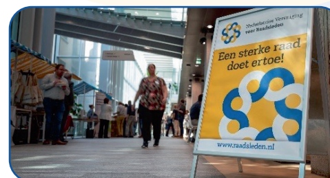
Dag voor de Raad (juni 2025, Tilburg)