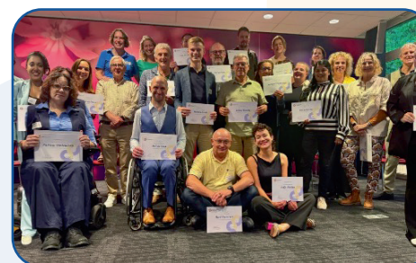
Zomerraad 2025 (Doorn, september 2025)

Op zoek naar verdieping als raadslid? In september organiseren we de Zomerraad: een meerdaagse bijeenkomst